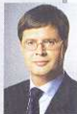
Jan Peter Balkenende

Il governo olandese, presieduto da Jan Peter Balkenende , ha dato il via all'iter per l'approvazione della nuova legge sui servizi finanziari. La nuova misura, che entrerà in vigore il prossimo anno, prevede, tra le altre cose, che il broker sia direttamente responsabile delle capacità professionali dei suoi collaboratori. Condizione contestata dalle due associazioni di categoria che operano in territorio olandese, la Nva e la Nbva. I membri delle due strutture si sono detti favorevoli a una norma che attribuisca la responsabilità a qualsiasi operatore che sia in contatto con la clientela.