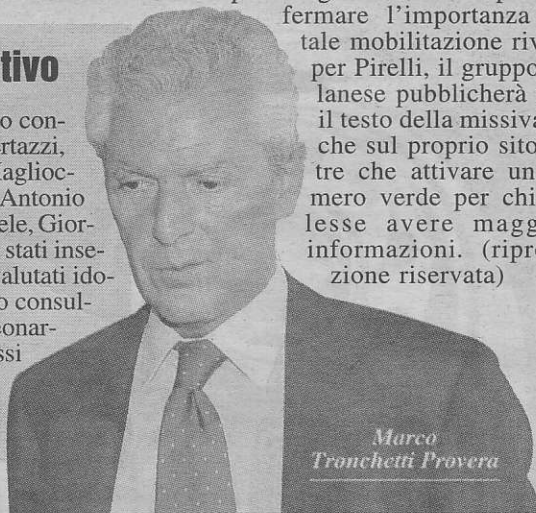
Marco Tronchetti Provera