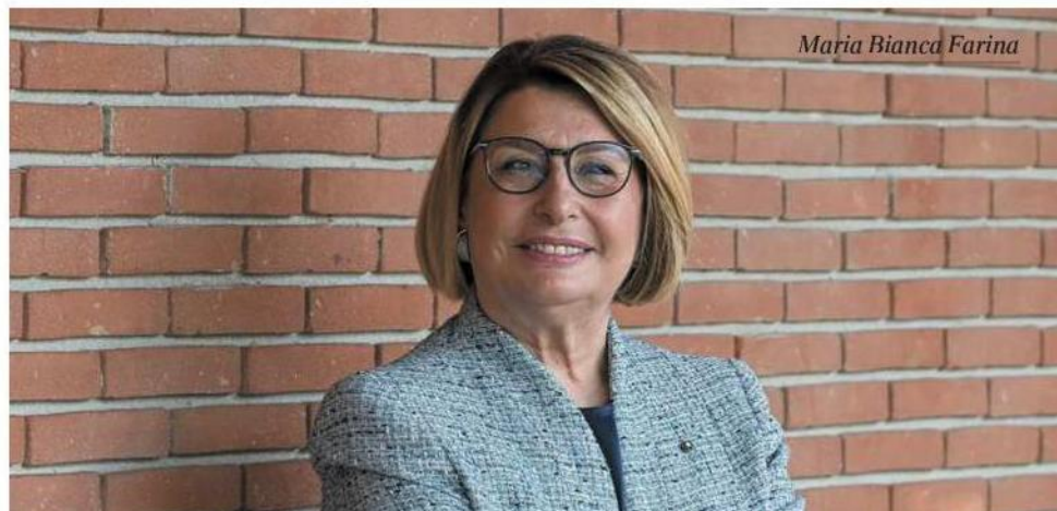
Maria Bianca Farina