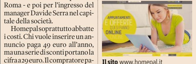
Il sito www.homepal.it

Comefinanzia Ecco il modello di business di Homepal, startup lanciata lo scorso mese di settembre. Chi vuole inserire un annuncio paga 49 euro all'anno, ma si scende fino a 29 euro. Il compratore paga 290 euro in caso di acquisto, l'affittuario 90 euro per la locazione.