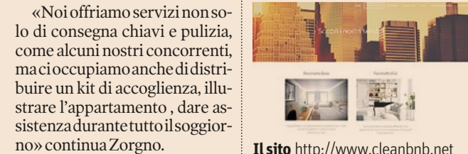
Il sito http://www.cleanbnb.net

Chisone CleanBnB è una startup nata proprio per l'amministrazione di appartamenti nella nicchia dell'affitto breve sul modello AirBnB e punta a sostituirsi nella gestione quotidiana al proprietario, che per evitare questo lavoro impegnativo arriva a rinunciare all'affitto.