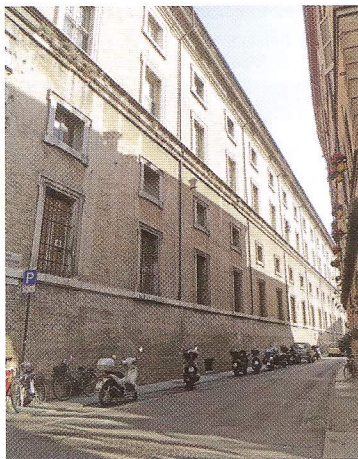
L'Università di Parma

intermediario professionale di assicurazione da parte degli studenti.