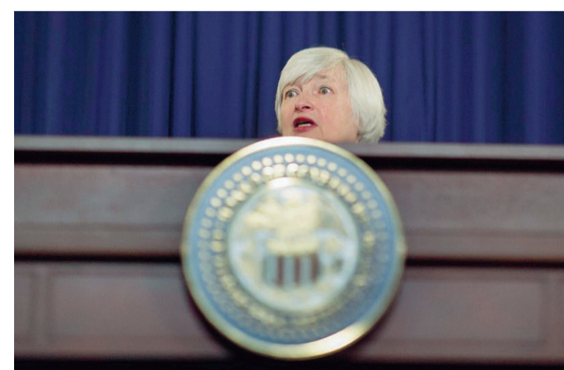
Ai due lati dell'Atlantico Mario Draghi (in alto) e Janet Yellen.

I RIFLESSI SUI MERCATI: I TITOLI PIU' SENSIBILI AL CAMBIO