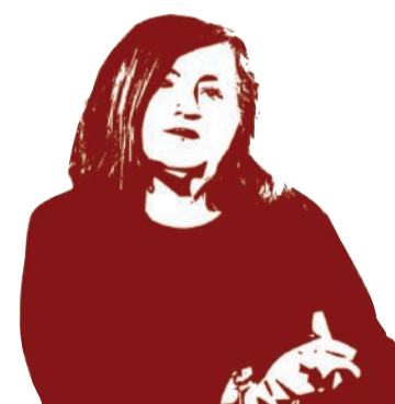
di PATRIZIA GINEPRI