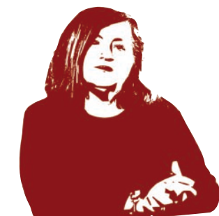
di PATRIZIA GINEPRI