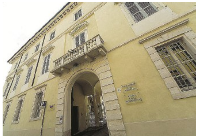
Crowdfunding Mercoledì convegno a Palazzo Soragna.

Mercoledì, a partire dalle 10, si terrà a Palazzo Soragna un convegno sul tema del crowdfunding organizzato dall'Unione Parmense degli Industriali, dal Dipartimento di Economia-Sezione Banca, Finanza e Assicurazioni dell'Università di Parma e da Teseo Scuola di formazione. Il convegno intende approfondire le problematiche giuridiche, regolamentari ed economico-finanziarie del crowdfunding, soprattutto per le opportunità che lo strumento offre ai fini del finanziamento delle piccole e medie imprese.